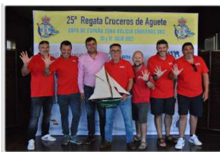
Vencedor O.R.C. CRUCERO REGATA 2022