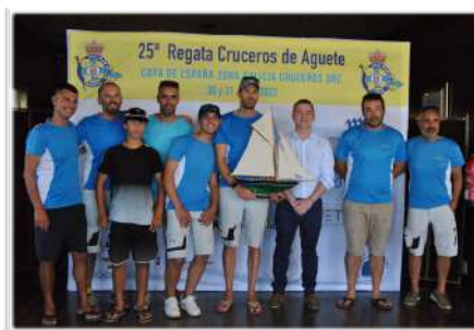
Vencedor O.R.C. REGATA 2022