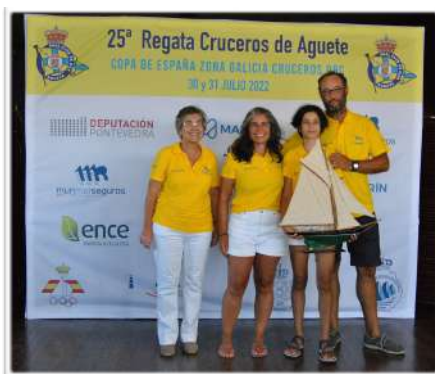
Vencedor CLÁSICOS Y VETERANOS 2022