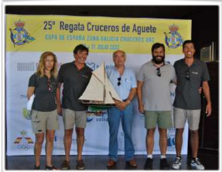
Vencedor O.R.C. CRUCERO 2022