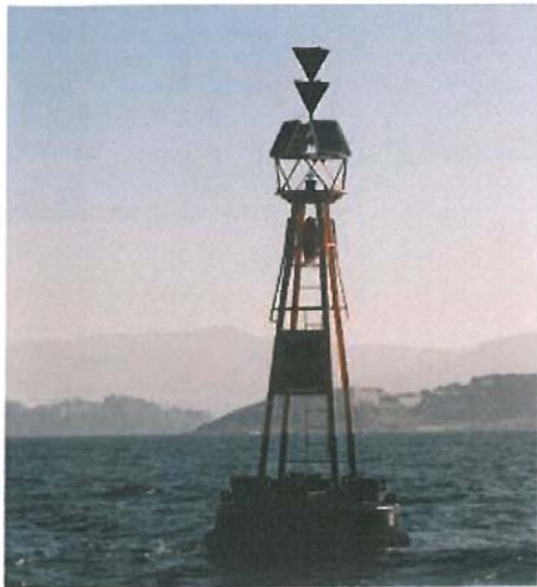
BOYABAJO LOS CARALLONES Número Nacional 05234 Latitud 42° 08,10N Longitud 008° 52,90W Notas DISPONE DE REFLECTOR RADAR