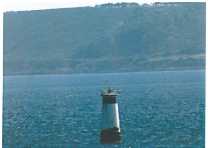
BAJO PICAMILLO Número Nacional 04560 Latitud 42° 24,30N Longitud 008° 53,40W