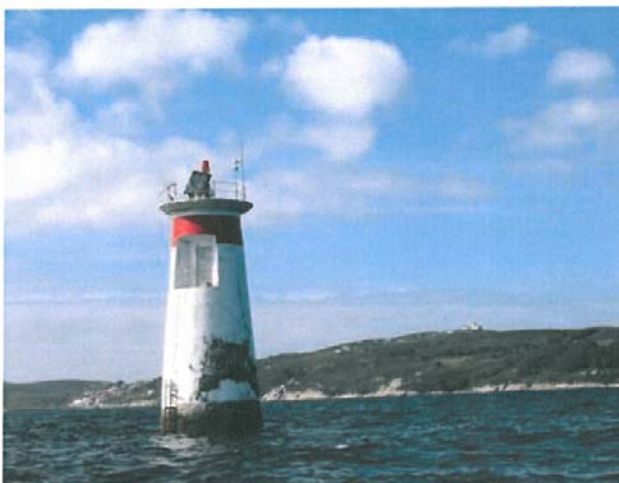
BAJO LOS CAMOUCOS Número Nacional 04540 Latitud 42° 23,80N Longitud 008°54,70W