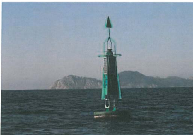
BOYABAJO BONDAÑA "1" RÍA DE VIGO Número Nacional 05150 Latitud 42° 12,40N Longitud 008° 48,50W Notas DISPONE DE REFLECTOR RADAR