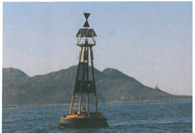
BOYA AL NORTE DE LAS SERRALLEIRAS . LA NEGRA Número Nacional 05232 Latitud 42 09,20N Longitud 008 53,30W Notas DISPONE DE REFLECTOR RADAR