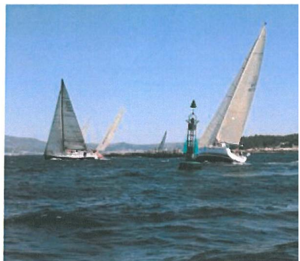
04250 - BOYA DEL BAJO TER Número nacional: 04250 Latitud: 42 34,50N Longitud: 008 53,80W DISPONE DE REFLECTOR RADAR